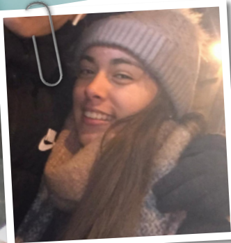
Candela, TY Loreto Kilkenny, Kilkenny Co.

Sólo he estado un trimestre pero he avanzado muchísimo con el inglés. Dejo muchas amigas en mi colegio y espero regresar en Transition Year.